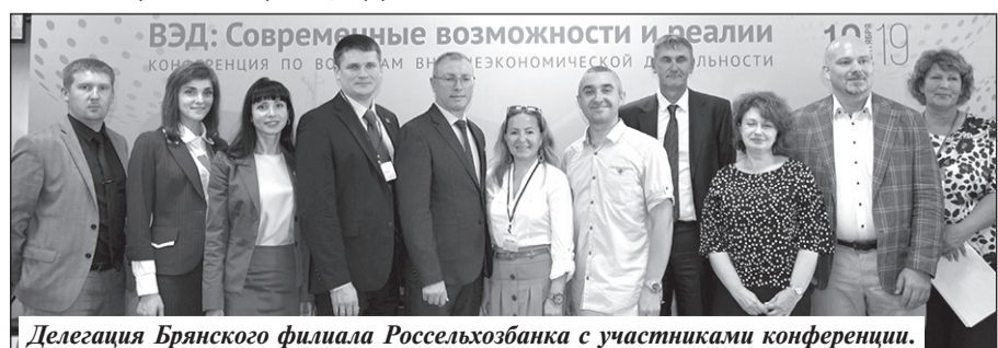
Делегация Брянского филиала Россельхозбанка с участниками конференции.

АО «Россельхозбанк» — основа национальной кредитно-финансовой системы обслуживания агропромышленного комплекса России. Банк создан в 2000 году и сегодня является ключевым кредитором АПК страны, входит в число самых крупных и устойчивых банков страны по размеру активов и капитала, а также в число лидеров рейтинга надежности крупнейших российских банков.