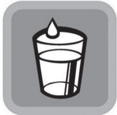
пей чистую воду