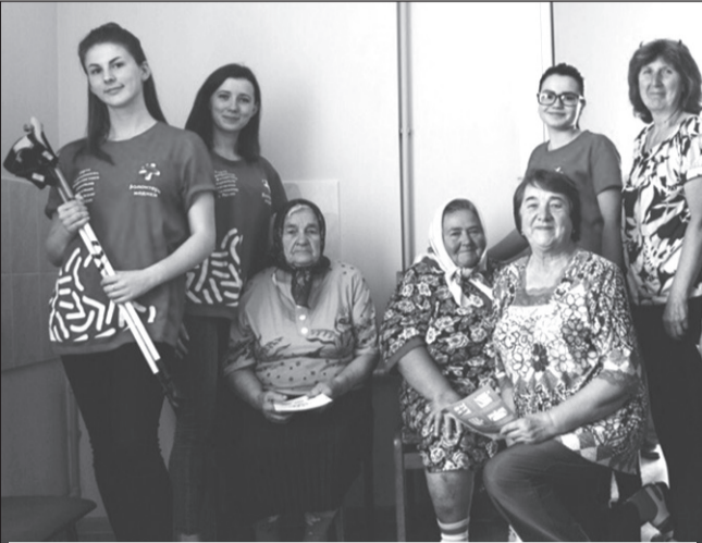
11 сентября волонтеры-медики из Брянского медико-социального техникума им. Н.М. Амосова посетили ФАП деревни Найтоповичи Унечского района.

Полезным содержанием наполняются, реализуясь в регионах, 12 национальных проектов. Особенно наглядно видно это на примере выполнения задач, поставленных в нацпроект «Здравоохранение».